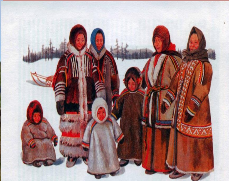
Рис. 12. Женщины и дети в зимней одежде